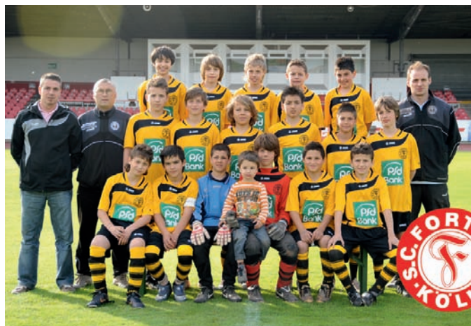
Auch die Jugendfußballmannschaft des SC Fortuna Köln e.V. freute sich über eine finanzielle Unterstützung