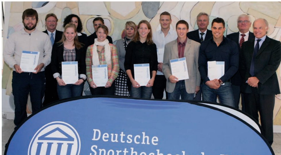
Am 15. Oktober erhielten die Stipendiatinnen und Stipendiaten ihre Urkunde von den Stipendiengabern: GFF, Telekom Stiftung, Mysporty, PSD Bank Köln, Gold-Kraemer-Stiftung, Dr. Thomas Bscher.

Die PSD Bank Köln engagiert sich auch für die Stipendiaten 2011. Zusätzlich werden ab Oktober 25 weitere Studierende der DSHS mit neuen Bundesstipendien, den sogenannten Deutschlandstipendien, unterstützt.